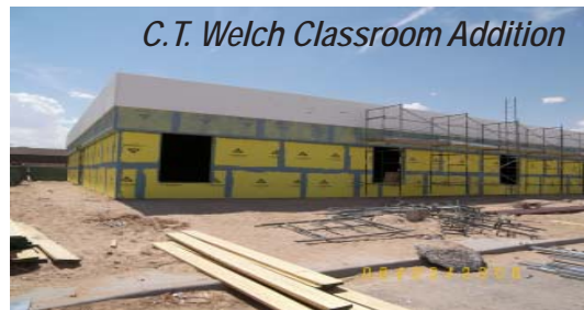
C.T. Welch Classroom Addition

Facility upgrades-Mejoras a las instalaciones