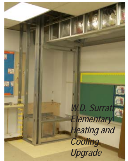
W.D. Surratt Elementary Heating and Cooling Upgrade