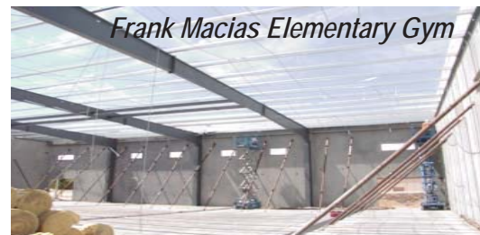
Frank Macias Elementary Gym