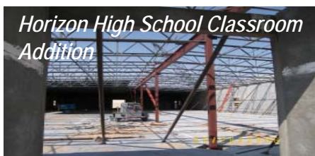
Horizon High School Classroom Addition